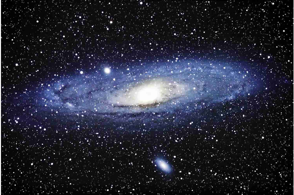
Abb. 5: M 31, 7 x 5 min belichtet mit Pentax 105 SDHF bei 504 mm Brennweite

Die Aufnahme besteht zwar bloss aus zwei fünfminütigen Teilbelichtungen, weist aber bereits erstaunlich viele Sterne auf. Dass man mit der EOS 10D auch ins Reich der Galaxien vordringen kann, soll die Aufnahme des Andromedanebels M 31 samt Begleitgalaxien illustrieren (vgl. Abb. 5). Es wurde dafür bei einer Temperatur von ca. – 10 Grad 7 mal 5 Minuten lang belichtet. Als Instrument diente hier ausnahmsweise ein Pentax 105 SDHF Refraktor bei Blende 4.8.