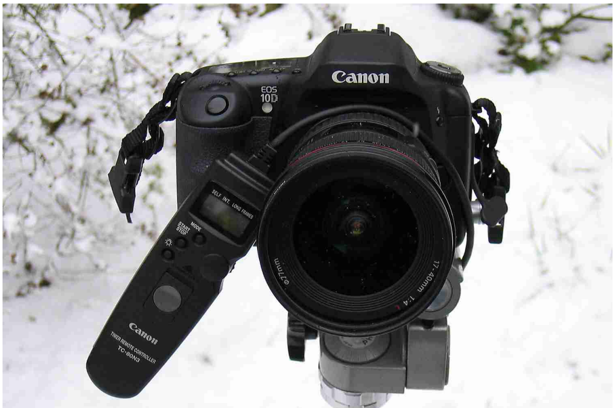
Abb. 1: Die Canon EOS 10D mit Timer-Auslösekabel TC-80N3 und Zoom 17-40 mm

Im Frühjahr 2003 brachte Canon die digitale Spiegelreflexkamera EOS 10D auf den Markt. Ausgestattet mit einem 6.3 Megapixel-CMOS-Sensor und einem stabilen Magnesiumgehäuse ist sie im halbprofessionellen Bereich angesiedelt. Erste Tests durch Amateur-Astrofotografen ergaben ein erstaunlich geringes Dunkel-Rauschen des grossen (15.1 x 22.7 mm messenden) Farbsensors. Lässt sich damit erstmals eine erschwingliche digitale SLR-Kamera mit auswechselbaren Objektiven ohne Abstriche für die Fotografie lichtschwacher galaktischer und extragalaktischen Objekte einsetzen? Wie sich dieses Nachfolgemodell der ebenfalls bereits astrotauglichen EOS D60 (vgl. dazu Interstellarum 27, S. 62 ff.) bei ersten diesbezüglichen Versuchen bewährt hat soll nachfolgend ausgeführt werden.