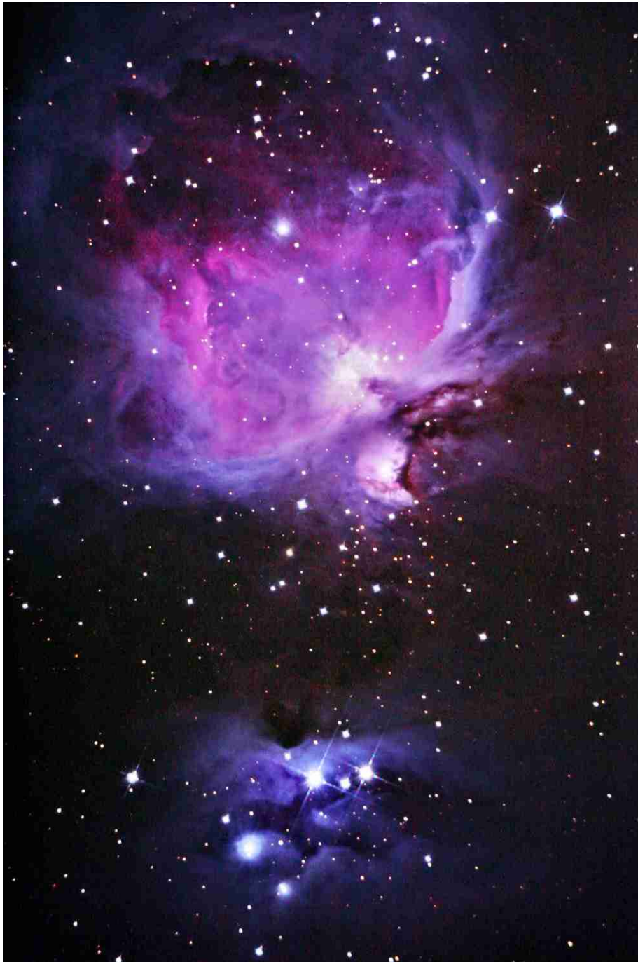
Abb. 7: M 42, 13.5 min totale Belichtungszeit mit Tak MT-160 bei 1000 mm Brennweite

Im Nachgang zu jeder Einzelaufnahme kann jeweils die Platzierung des Objekts, die Schärfe der Sternpunkte sowie die Bildsättigung auf einfachste Weise am kameraeigenen TFT-Monitor begutachtet werden. Ich arbeite dafür regelmässig mit der Lupenfunktion des Monitors, welche wie gesagt eine 10-fache Vergrösserung des Bildes erlaubt. Nötigenfalls kann jede Aufnahme leicht wiederholt werden. Die für jede Astroaufnahme zur nachträglichen Subtraktion des Dunkelrauschens am Heim-PC erforderlichen Dunkelbilder können anschliessend an die gelungene Belichtungssequenz des Himmelsobjekts auf einfache Weise erstellt werden, indem mit der selben Belichtungszeit wie die vorangegangenen Einzelaufnahmen Dunkel-Aufnahmen (mindestens fünf Stück) mit aufgesetztem Teleskopdeckel erstellt werden.