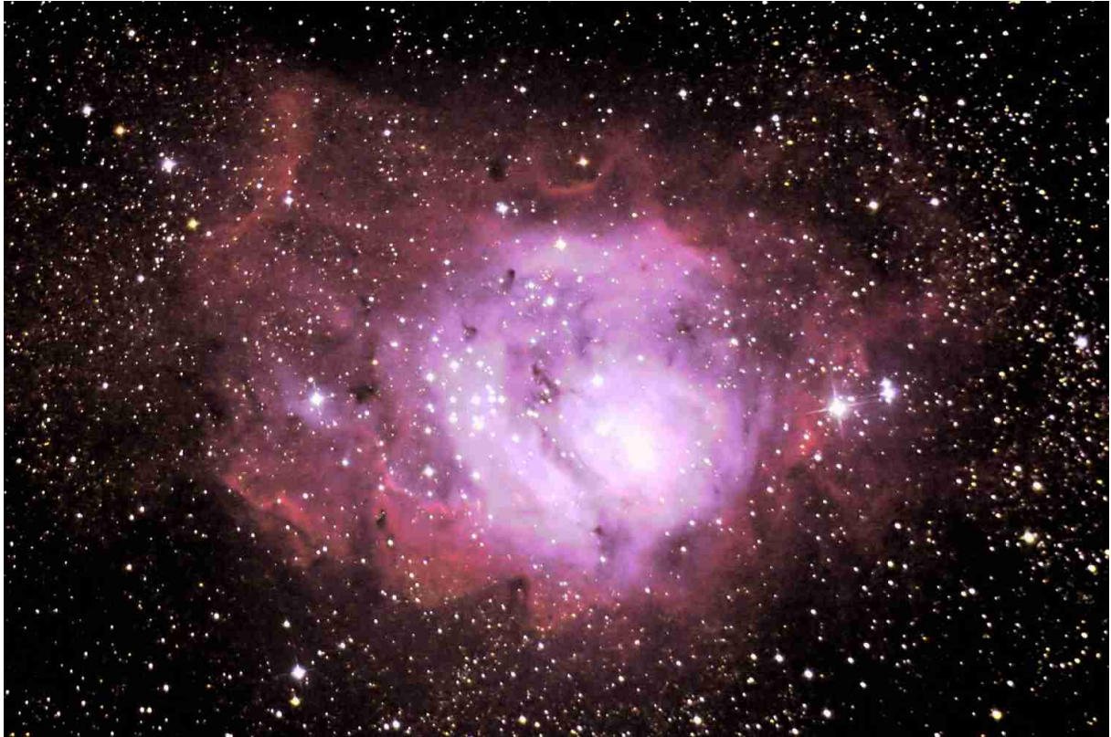
Abb. 3: M 8, 2 x 8 min belichtet mit Tak MT-160 bei 768 mm Brennweite

Abb. 4 zeigt den Kugelsternhaufen M 13, diesmal bei einer Brennweite von 1000 mm (f 6.25) fotografiert.