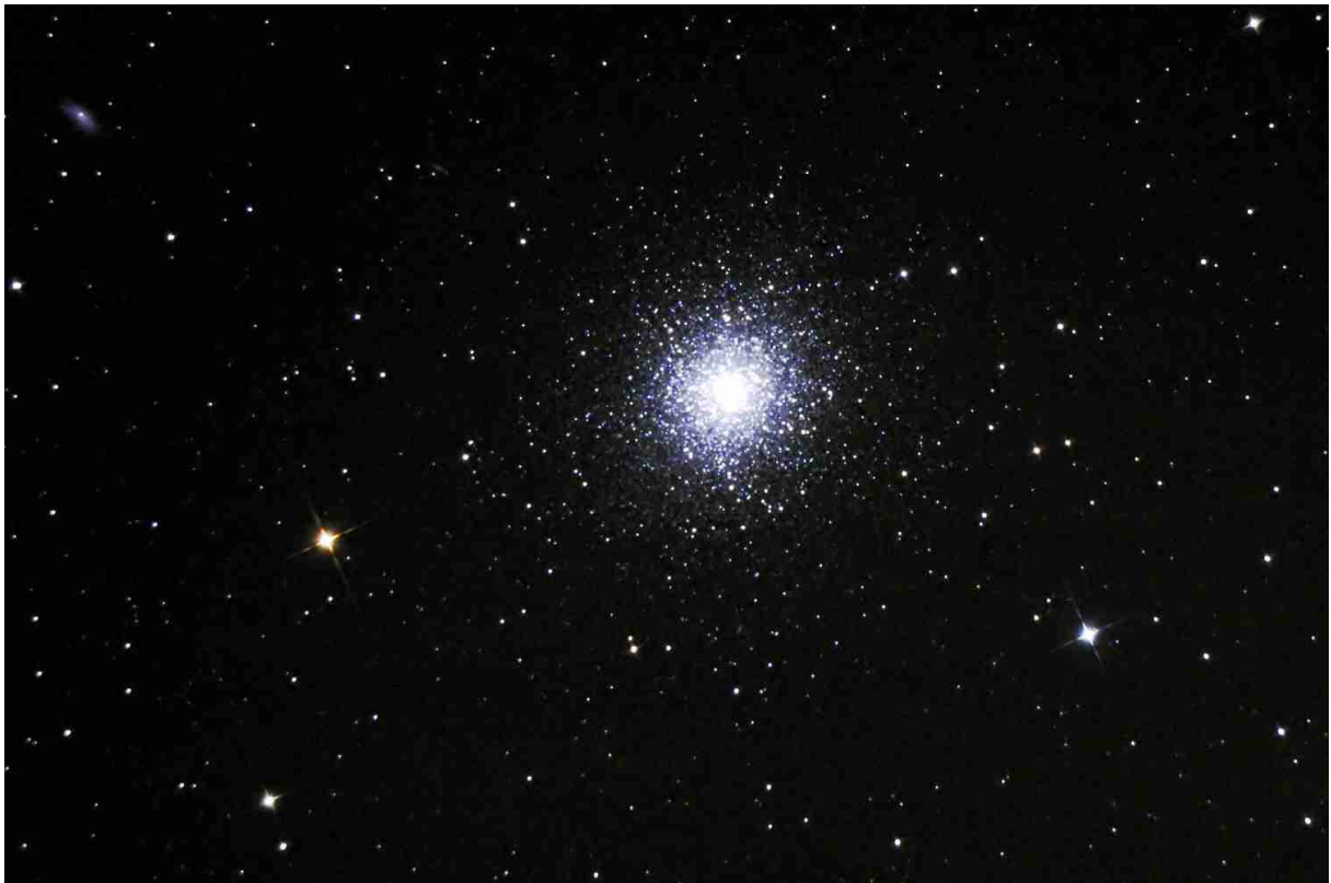
Abb. 4: M 13, 2 x 5 min belichtet mit Tak MT-160 bei 1000 mm Brennweite

Abb. 4 zeigt den Kugelsternhaufen M 13, diesmal bei einer Brennweite von 1000 mm (f 6.25) fotografiert.