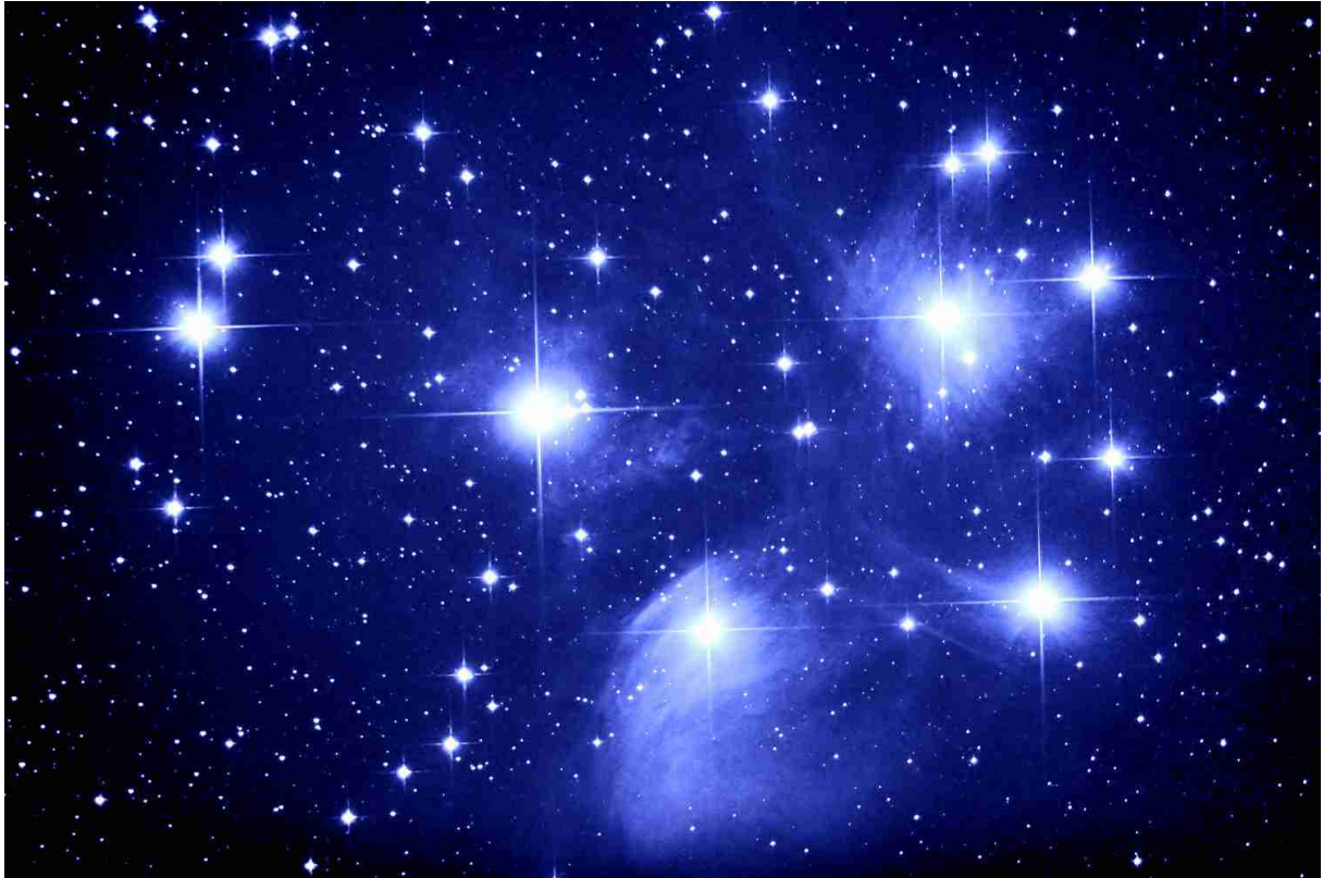
Abb. 2: M 45, 2 x 15 min belichtet mit Tak MT-160 bei 768 mm Brennweite

Die Auflösung sowie die feine Zeichnung in den blauen Nebeln haben mich positiv überrascht. Der Lagunennebel M 8 (vgl. Abb. 3), welcher 2 mal 8 Minuten belichtet wurde, hat zudem den grossen Dynamikumfang der EOS 10D zu Tage gefördert. Während Farbfilm aufnahmen bei diesem Objekt meist nur zwei bis drei Farben hervorbringen, zeigt die Aufnahme mit der 10D feine Farbabstufungen, wobei auch die dunklen HI-Regionen (Elefantenrüssel) deutlich zu sehen sind.